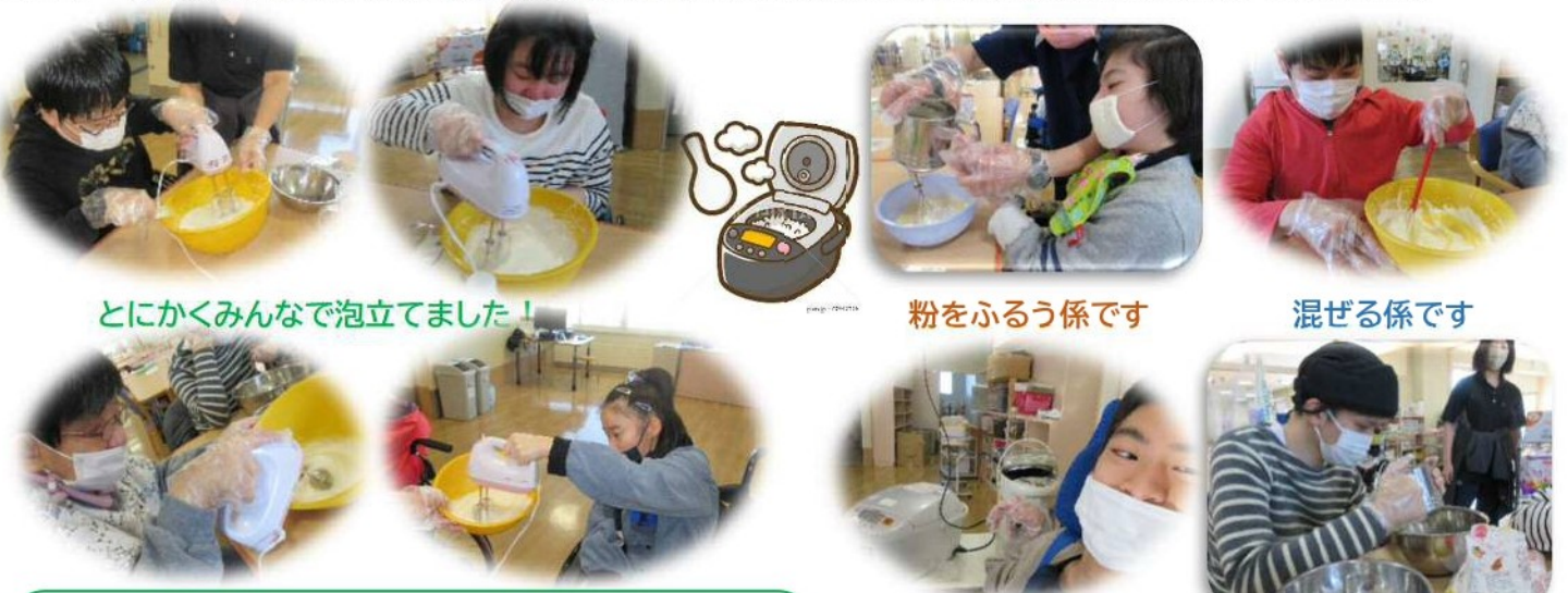
とにかくみんなで泡立てました!