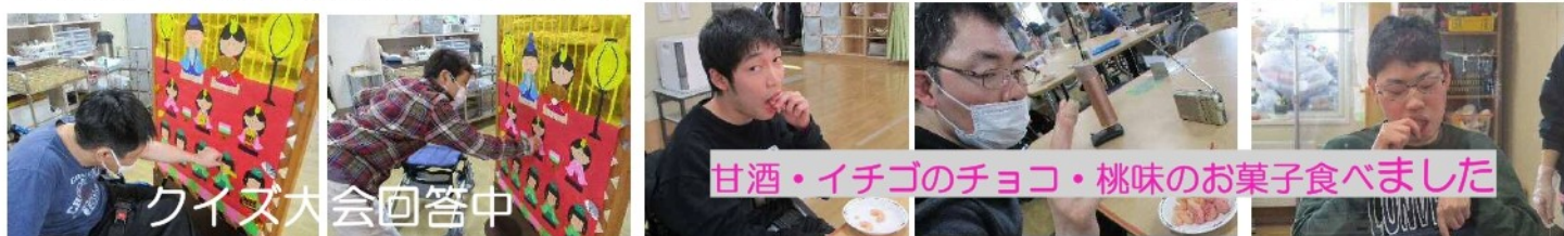
クイズ大会回答中

お雛様と記念撮影! その際、お雛さま達の役割は何ですか? ということをみんなで考えました。で、クイズ大会を開催しました。三人官女が太鼓の係りになったり? 五人囃子に三方を持たせたり? いつもと違ったひな祭りになりました。