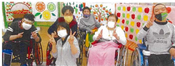
2月5日ポッチャチーム別対抗