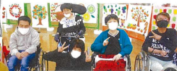
2月11日(祝日)ホットケーキ職員30分クッキング